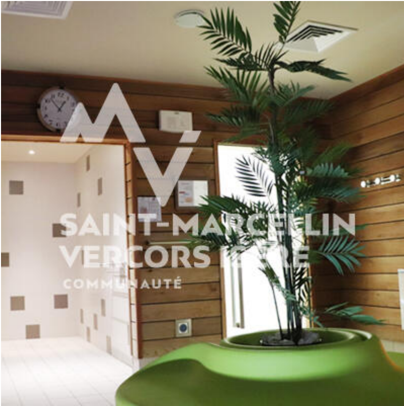
L'Olympide / Bien-être Chatte 04 76 38 35 38 Contacter par mail Relaxation et détente d'infos