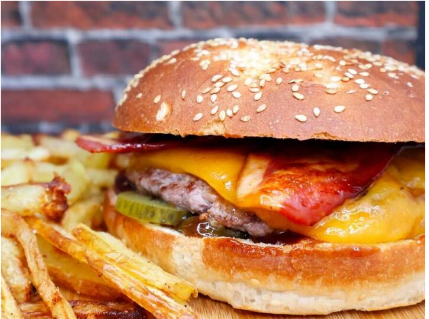
Holy Bun 38160 Chatte