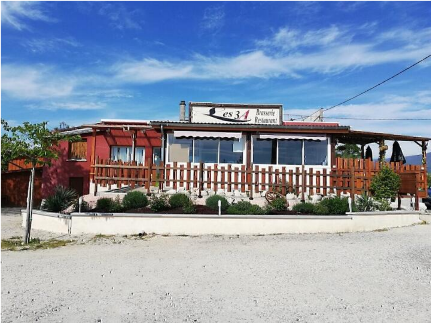
Brasserie Les 3A