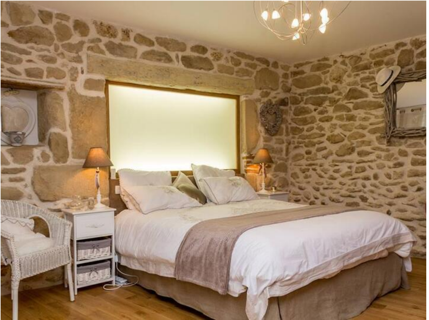
Le Val des sens 38160 Chatte

Le Val des Sens est en formule Chambre d'hôte avec ses 3 chambres, petit déjeuner compris. Ou alors formule Gîte indépendant avec 2 chambres, cuisine équipée,. Le gîte possède une terrasse couverte avec son bain à remous. Un accès de plein pied. Un parking devant le gîte. Les chambres sont toutes équipées de toilettes et salle de bains privées. Nous sommes situés au pied du Vercors, très proche du Village de Chatte. Les villages proches sont Saint Antoine l'Abbaye, plus beau village de France mais aussi Pont en Royans avec ses Maisons suspendues et son Musée de l'Eau. Beaucoup de restaurant à moins de 4 kms.