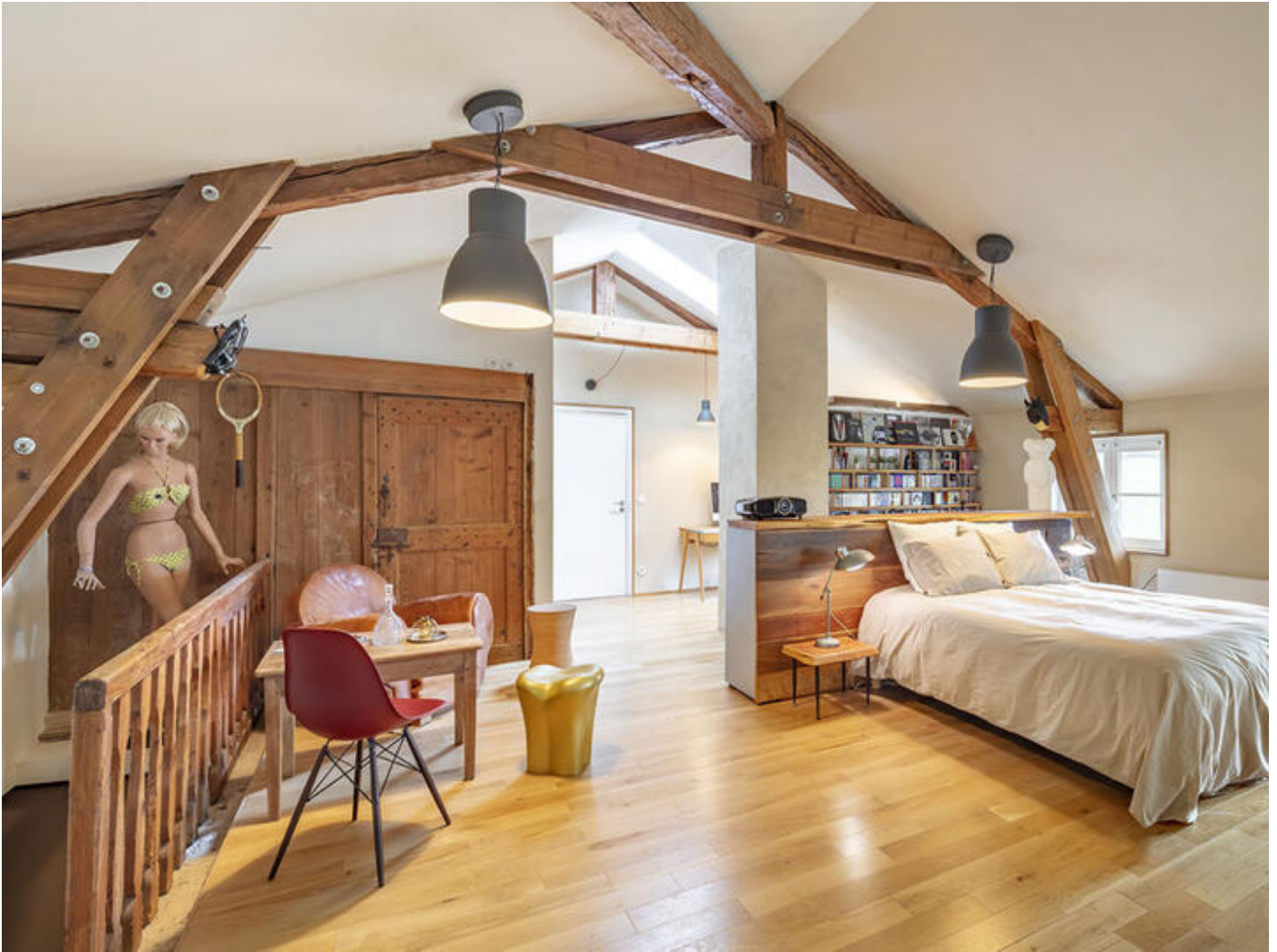
La Suite Vestiaire 38160 Chatte

Sous les combles, la Suite Vestiaire de 58m 2 peut accueillir confortablement 3 ou 4 personnes. Elle comprend un lit Queen Size dans l'espace principal et un lit simple dans le coin bureau séparé par une cloisonnette de brique, tandis qu'un lit supplémentaire peut très facilement être ajouté dans le volume principal. Des vestiges de l'ancien vestiaire des ouvrières sont encore visibles : une décoration subtile mélangeant antiquités et objets design.