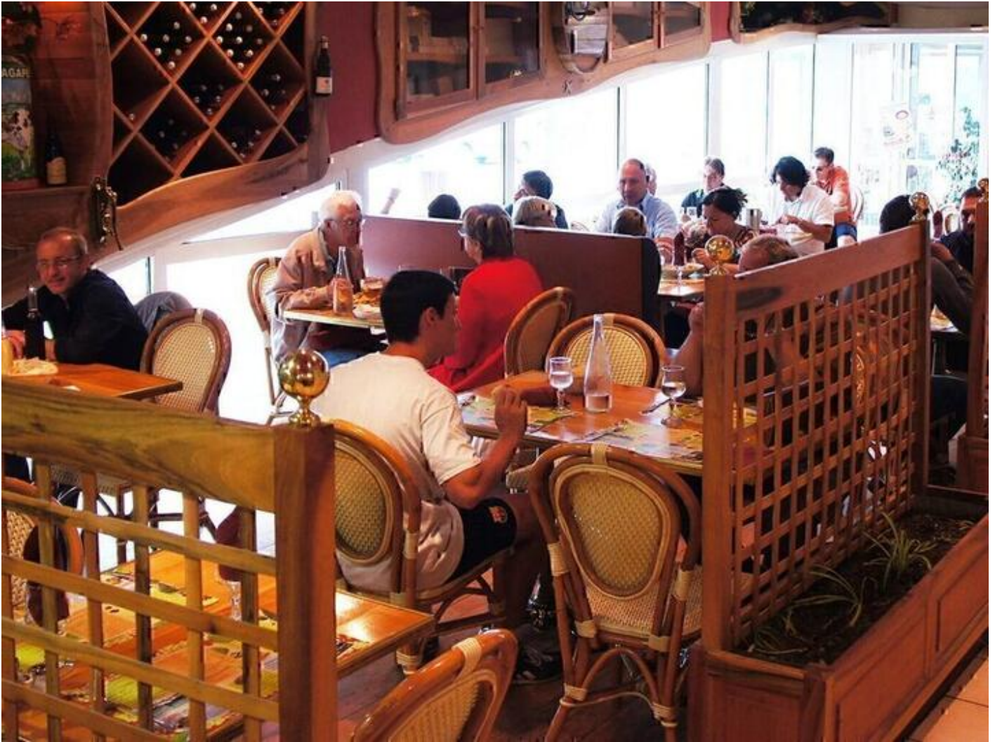
Brasserie les Agapes