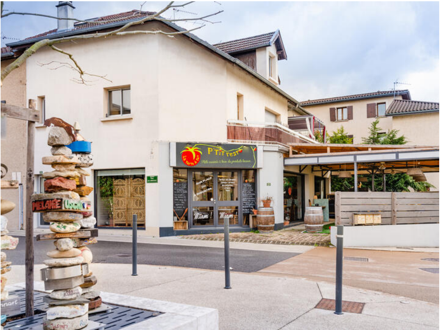
Ô p'tit resto de La Tarte à Fat 38160 Chatte