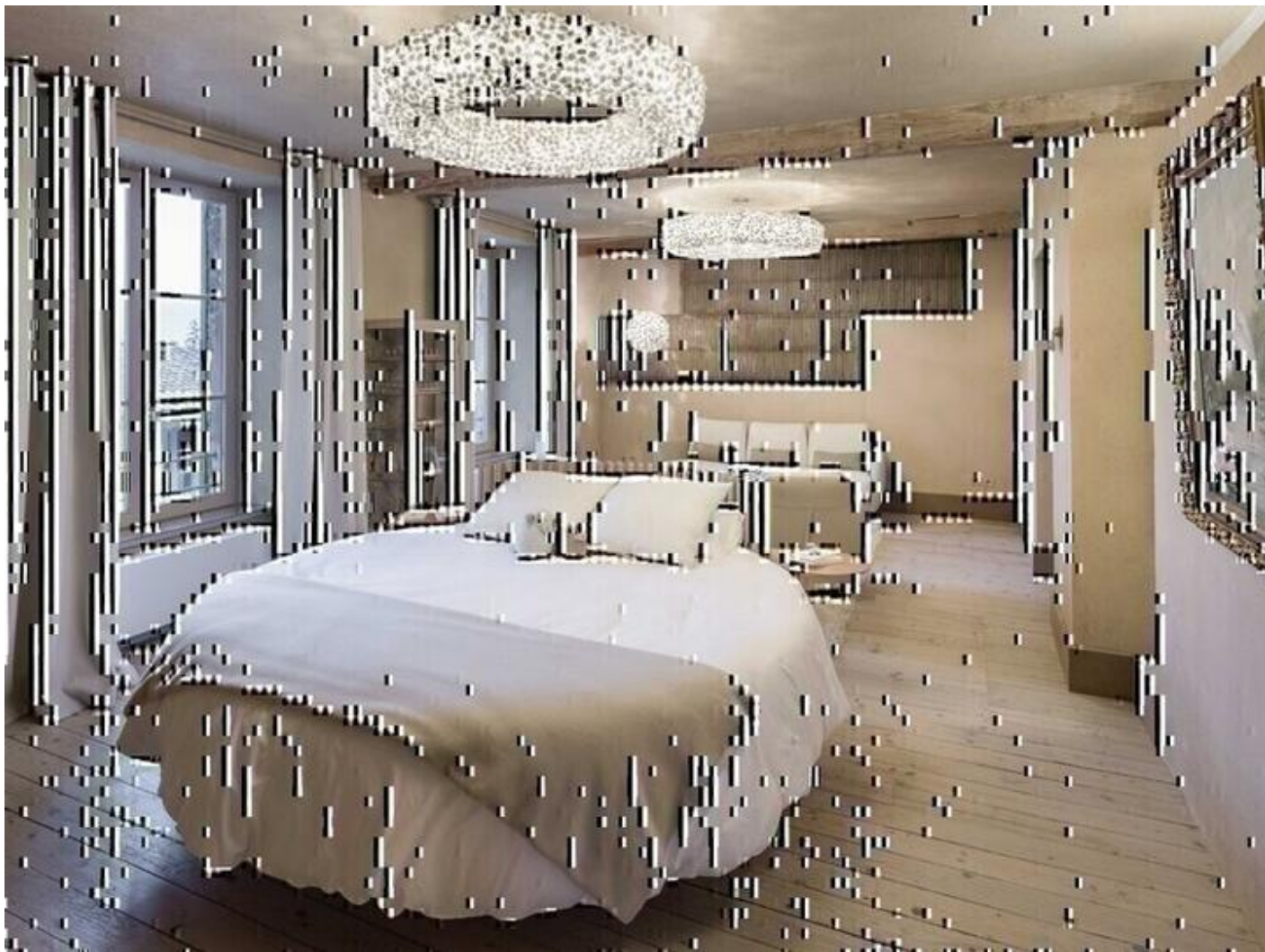
Suite Cocon A la Galicière