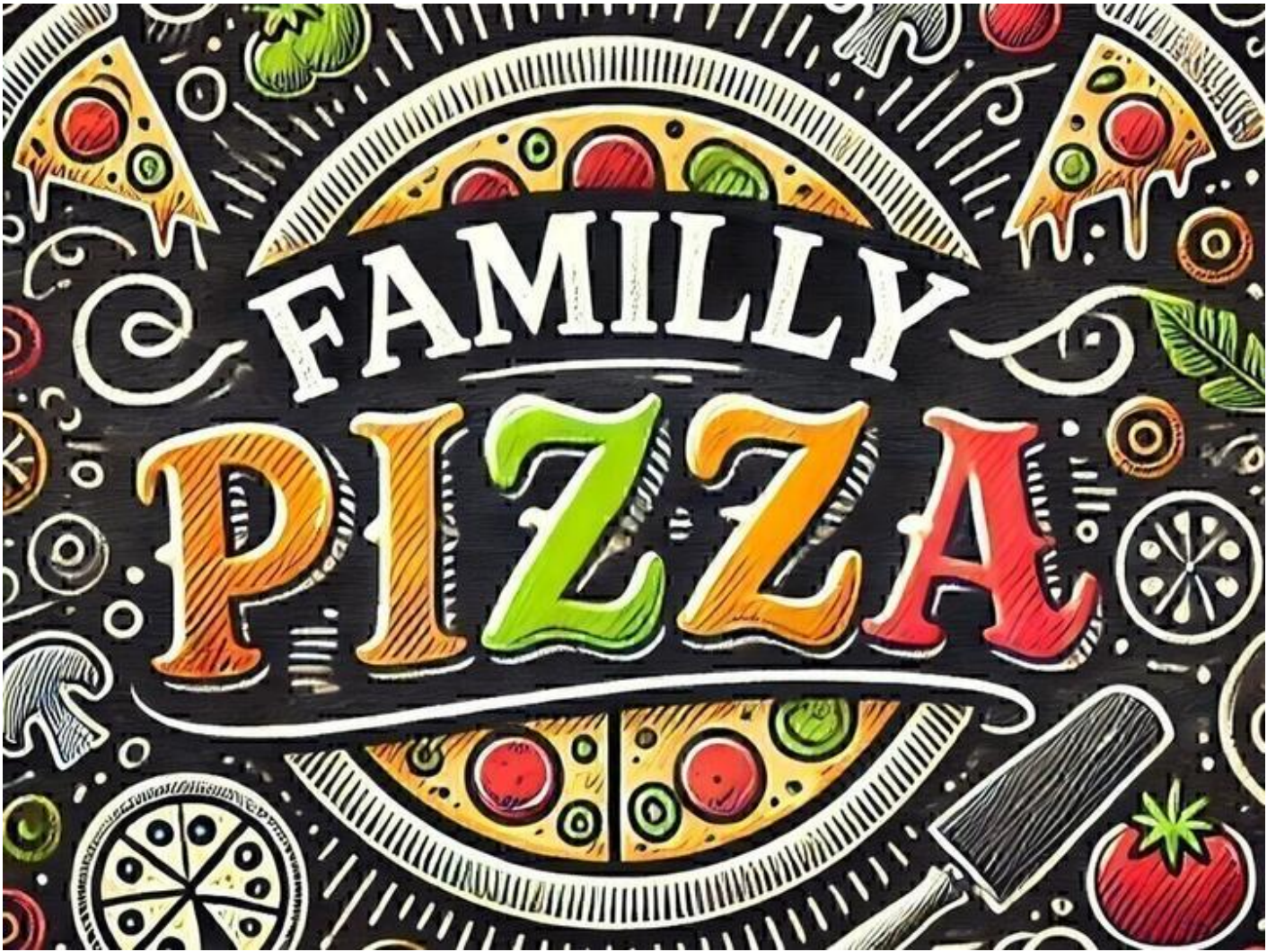
Family Pizza 38160 Chatte