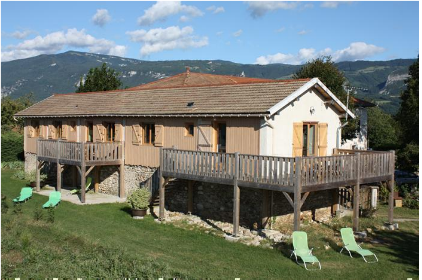
Cer de Bertiquière | Gîte 6 pers 38160 Chatte

Face au Vercors où vous pourrez vous rendre en 15min pour randonner ou visiter les routes du vertige; les maisons suspendues de Pont en Royans et les grottes de Choranche. Dans les coteaux pour d'autres sites touristiques (Saint-Antoine l'Abbaye; Palais Idéal du Facteur Cheval, Saint-Nazaire en Royans). Centre aquatique à 5min.